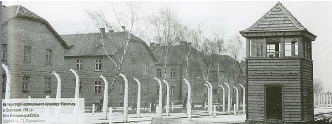
На території колишнього Аушвіцу-Біренкау. м. Освенцім, 1945 р.