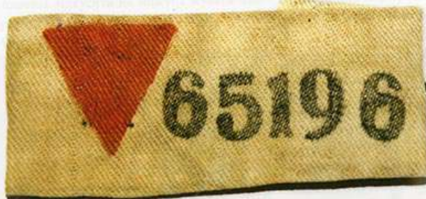
Табірний № 65196 Ольги Клименко. Лушвіц, 1942 р. Фонди НМІУД(СВ) – ЮН-12432. – РТ-1088.