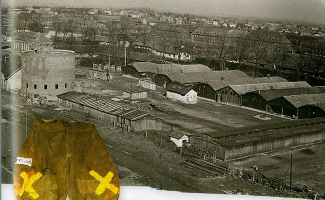
Загальний вигляд Аушвіцу-Біреннау. м. Освенцим, 1945 р.